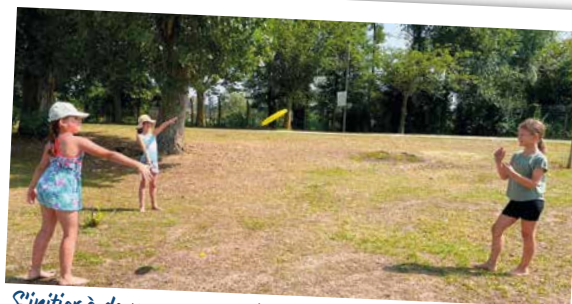
S'initier à de nouveaux sports avec l'ultimate.