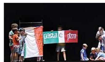
Avoir confiance en moi en montant sur les planches.

Le centre de loisirs est ouvert les mercredis et lors des vacances scolaires. Inscription en ligne via l'espace familles sur gouvieux.fr Renseignements : coordination-enfance@gouvieux.fr