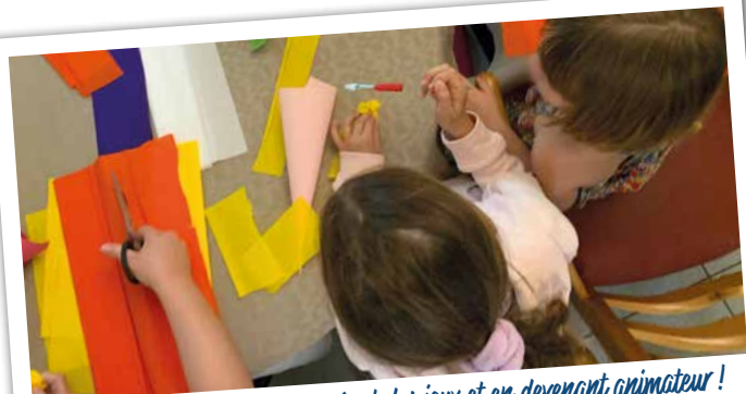
M'occuper des plus petits en créant des jeux et en devenant animateur !