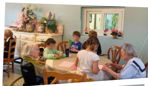
Développer mes capacités d'interaction avec les autres grâce au jeu secret story et les ateliers créatifs à la Fontaine Médicis.