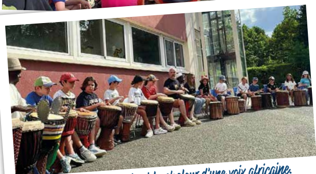
Découvrir des instruments et la chaleur d'une voix africaine.