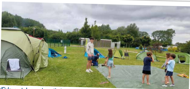
Relance de la semaine estivale de camping ! Canoë, paddle, pédalo, toboggan, plage et veillée nocturne autour du feu.