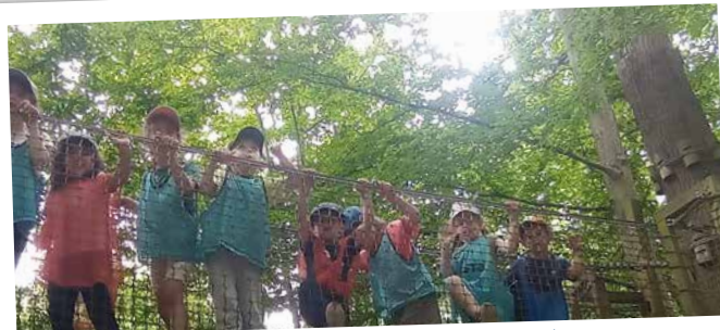
Vaincre mes peurs lors de notre sortie à Sherwood Park.