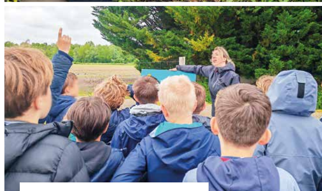
Les 30 et 31 mai Journées d'entretien de la micro-forêt de Moulin Lagache par les élèves des écoles.