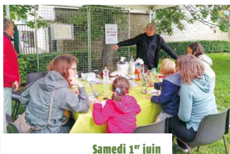
Samedi 1 er juin Après-midi « Terre » à la Bibliothèque.