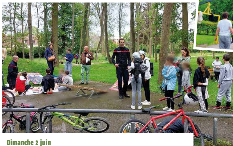
Dimanche 2 juin Fête de la Plaine de jeux. Plus de 400 personnes ont participé à cet événement.