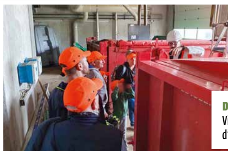
Dimanche 2 juin Visite de la station d'épuration.