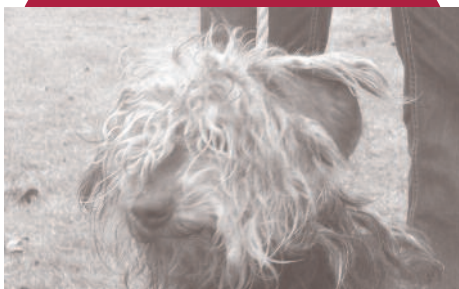
Chien perdu cherche son maître Téléphone : 03 44 57 01 72

Dernier cas de figure, celui des propriétaires indécis, sous couvert de divagation,