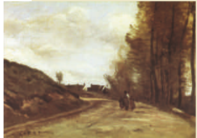
Gouvieux près Chantilly, La route

Gouvieux sera le décor de huit toiles du peintre