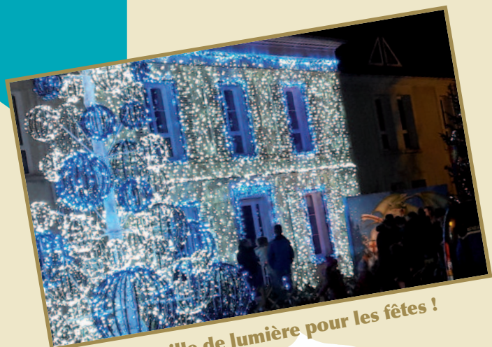
Gouvieux : ville de lumière pour les fêtes !