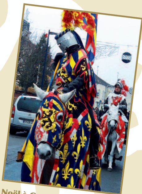
Noël à Gouvieux : des animations remarquées