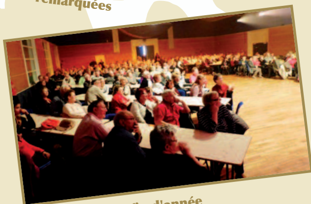
Le spectacle de fin d'année pour les seniors