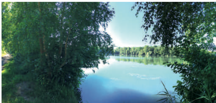
Les étangs sont nécessaires à la reproduction des crapauds