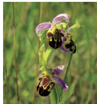
Ophrys abeille (orchidée)