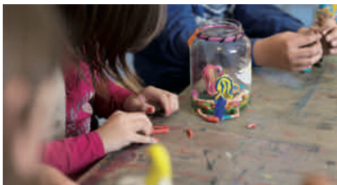
Les enfants à l'heure de l'atelier