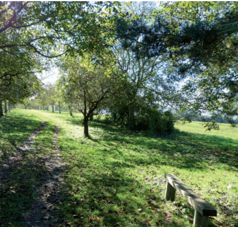
Compatible avec le pâturage des animaux, le verger est une des formes paysagères la plus emblématique de notre territoire. Conserver les vergers contribue à la diversité et à la qualité du paysage.

Les vergers godviciens sont à la veille de leur examen par le chargé de mission de l'association Connaître, Protéger la Nature (CPN). La taille de restauration débute en effet en mars et prendra une dizaine de jours