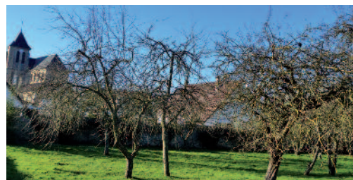
Le verger et son point de vue sur l'église