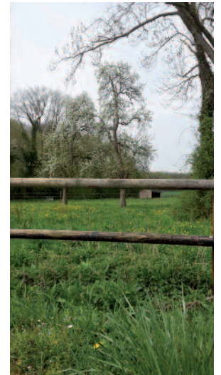
Les vénérables poiriers de la rue Paul Bert méritent un soin particulier

Les vergers godviciens sont à la veille de leur examen par le chargé de mission de l'association Connaître, Protéger la Nature (CPN). La taille de restauration débute en effet en mars et prendra une dizaine de jours