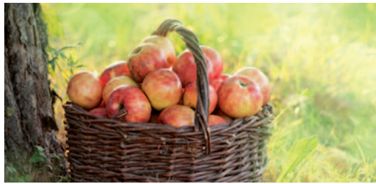
Entretien des vergers municipaux pour qu'ils portent leurs fruits