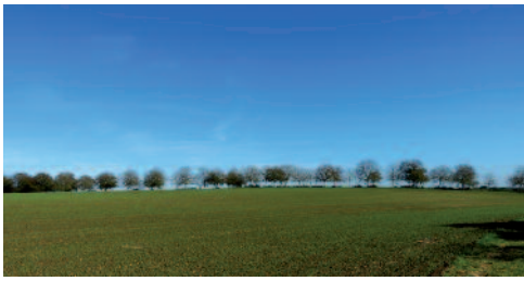
Les noyers façonnent le paysage du Camp de César