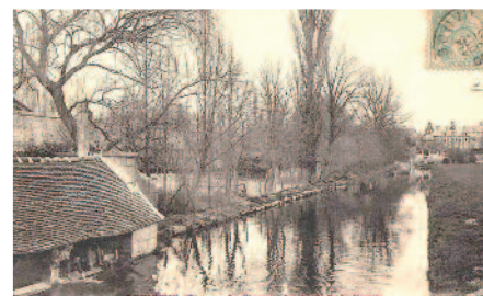
Les bords de la Nonette à La Chaussée

Informations et réservations : 06 38 57 43 59 animatrice.sagenonette@gmail.com