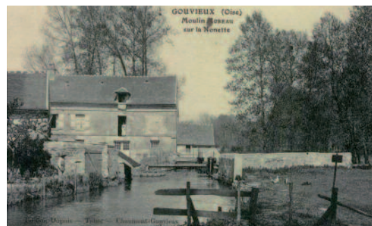
Le moulin Moreau