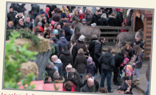
Le salon de l'agriculture à Paris ? Non ! La ferme de Noël à Gouvieux