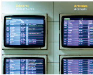
...et à l'aéroport Charles de Gaulle