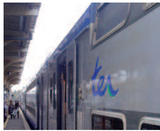
Des TER en gare de Chantilly