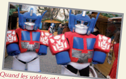
Quand les soldats et les robots débarquent