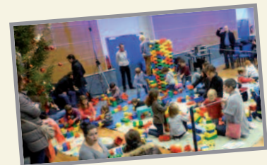
Les enfants construisent à la salle des fêtes