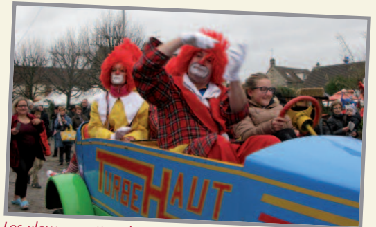
Les clowns mettent le "turbe haut"

Pour les Godviciens absents, quelques photos souvenirs