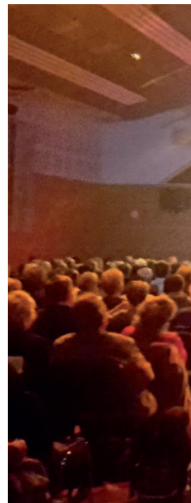
Le spectacle offert par le CCAS

A quelques jours de Noël, les seniors âgés de plus de 70 ans reçoivent un colis alléchant : foie gras de canard et confit de figues, rillettes royales au foie gras et Montbazillac, croustillant aux poires et pépites de chocolat, pruneaux à l'armagnac et dessert pomme-ananas-passion, pâtes de fruit et ballotin de truffes citron-meringue, sans oublier les incontournables papillotes.