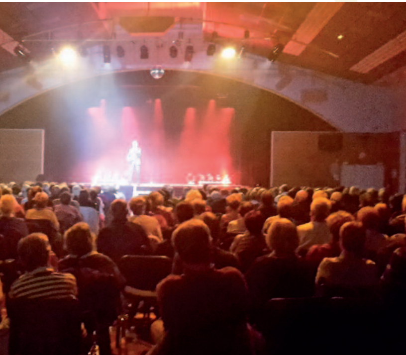
AS de la ville de Gouvieux a rassemblé 400 personnes à la salle des fêtes

Autour de Noël à Gouvieux, il y a donc des Noëls. Afin que l'on admire le feu d'artifice du samedi soir sur la place de la mairie mais qu'on le retrouve aussi, à tous les instants, dans les yeux des petits et des grands