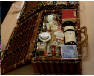
Un colis alléchant pour les seniors