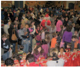
L'arbre de Noël de la petite enfance