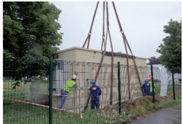
L'installation des NRO au collège...

Les noeuds de raccordement optiques principaux (NRO) sont installés, rue du Saulieu, dans l'enceinte du collège et sur le parking derrière la mairie ainsi que les 6 sous-répartiteurs optiques (armoires de rue). Les travaux se poursuivent par l'installation des fibres dans les fourreaux et sur les poteaux.