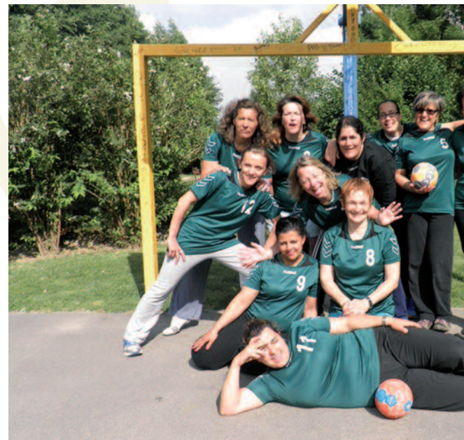
Une équipe féminine au club de Hand

Arts et Loisirs a organisé en février son salon Peintures et Sculptures « Arts d'Oise à Gouvieux », avec une formule renouvelée. Elle incitait les artistes à présenter deux interprétations d'un même sujet : l'une figurative et l'autre plus abstraite ou imaginative. Les 600 visiteurs ont beaucoup apprécié cette initiative. En juin,