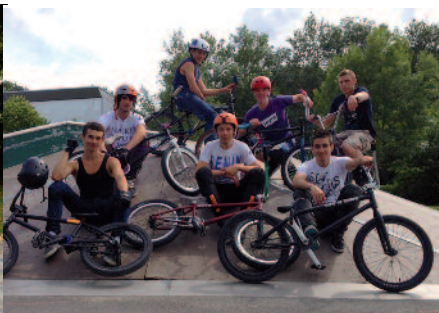
Les Riders sur le skate-park