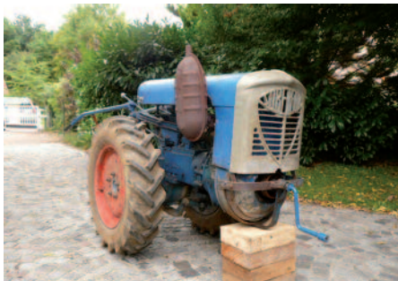
L'aide matérielle de GuinéeÔ