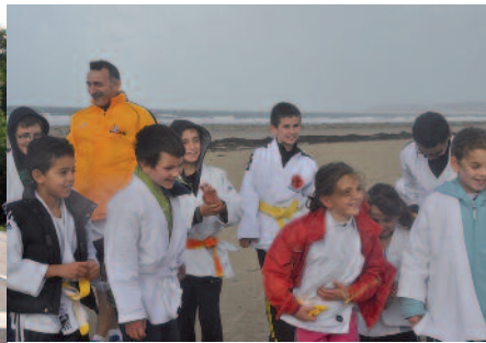
Bons résultats pour les judokas