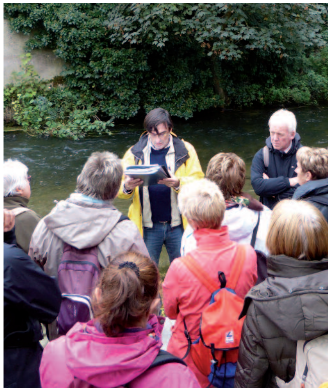
En octobre, le Parc naturel régional proposait une randonnée nature et découverte sur Gouvieux. Plus de quarante personnes ont profité de cette initiative qui vient souligner la sortie de la plaquette "découverte de la commune de Gouvieux" distribuée avec le présent numéro de Contact.

Le Parc naturel régional a proposé à 24 communes, dont Gouvieux, une démarche de gestion différente de ses espaces verts et de sensibilisation de ses habitants à ce sujet. Un diagnostic ainsi qu'un plan d'actions ont ainsi été définis pour mettre en place un entretien adapté à chaque espace vert. Les entrées de ville, les abords des édifices publics font toujours l'objet d'un soin particulier. En revanche, le désherbage des poteaux et autres panneaux en pleine campagne est moins utile et le fauchage des bords de chemin devient moins intensif. Concrètement, il s'agit de poursuivre l'entretien des espaces verts ou plantés de la commune en veillant à limiter au maximum l'impact des interventions humaines sur l'environnement.