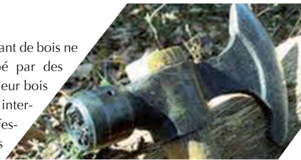
Un marteau, 2 usages : entailler l'écorce et marteler le bois d'un sceau

Vous croiserez peut être, dès janvier, des forestiers en opération de martelage. Cette opération consiste à désigner les arbres à retirer. En pratique, on marque le sujet d'un trait de peinture puis on effectue un flâchis (un enlèvement d'un peu d'écorce), avant de frapper le bois dénudé d'un sceau administratif officiel