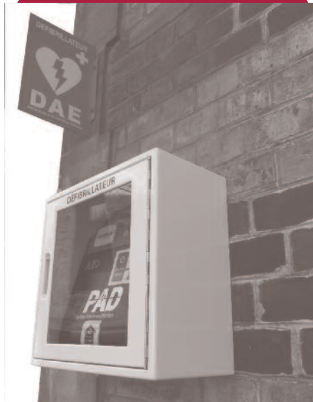
Des défibrillateurs dans toutes les écoles