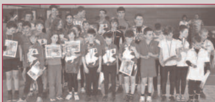
Les jeunes récompensés lors de la finale du critérium VTT le 25 mars dernier à Gouvieux

Elle s'est poursuivie par l'organisation de la randonnée de la Nonette ouverte à tous (marcheurs, cyclotouristes et vététistes soit 410 participants sur deux manifestations). Chacune des sections a programmé également des sorties de week-end, ou plusieurs jours par exemple à Cayeux avec une dizaine de jeunes de l'école cyclo et leurs encadrants.