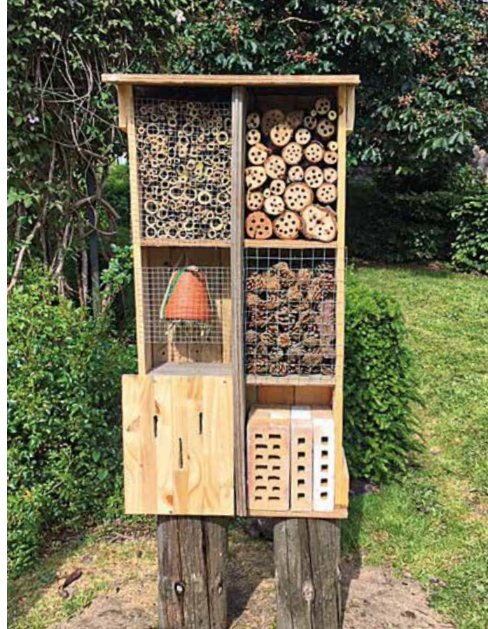
▲ ASSOCIATION VNV avec Ceneil, pour la fabrication d'un hôtel à insectes.

partenaires pour ces occasions croisées, institutionnels (Communauté de Communes de l'Aire Cantilienne, Syndicat du SAGE de la Nonette...) et associatifs (défense de l'environnement, clubs sportifs...), la Mairie a ainsi imaginé, conçu et organisé une multitude d'animations, pour petits et grands, certaines récurrentes, d'autres nouvelles, qui ont rencontré un réel succès, en dépit d'un contexte encore difficile et contraint aux plans sanitaire et réglementaire. Animations regroupées et proposées pour la première année au sein de « Journées de l'Environnement », dont le présent dossier présente une rétrospective qui appelle assurément d'autres éditions dans les prochaines années, que nous espérons tous sous de meilleurs auspices, afin d'en profiter davantage encore, de donner de l'ampleur à cette action majeure, et de porter notre commune sur la voie d'un réel développement durable, conciliant l'Homme et la Nature.