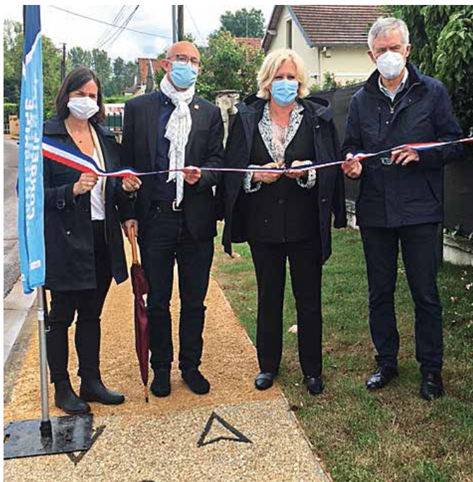
▲ LA COMMUNE DE GOUVIEUX ET LE CONSEIL DÉPARTEMENTAL DE L'OISE pour l'inauguration de la bande cyclable de la rue Corbier Thiébaud.