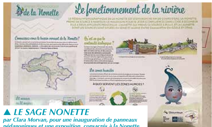
▲ LE SAGE NONETTE par Clara Morvan, pour une inauguration de panneaux pédagogiques et une exposition, consacrés à la Nonette.