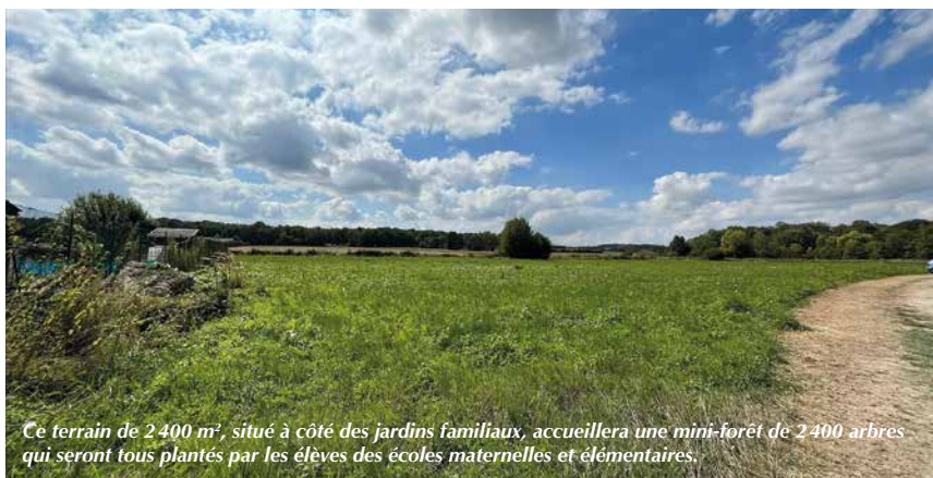
Ce terrain de 2 400 m 2 , situé à côté des jardins familiaux, accueillera une mini-forêt de 2 400 arbres qui seront tous plantés par les élèves des écoles maternelles et élémentaires.

La ville vient ainsi de solliciter une subvention auprès de la Région des Hauts-de-France pour la création d'une mini forêt de 1 600 arbres et 800 arbustes sur une parcelle située à proximité des jardins familiaux dans le cadre du projet de trame verte re-