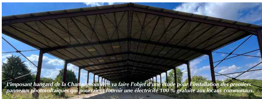
L'imposant hangar de la Champignonnière va faire l'objet d'une étude pour l'installation des premiers panneaux photovoltaïques qui pourraient fournir une électricité 100 % gratuite aux locaux communaux.