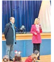
13 décembre Arbre de Noël de la Petite enfance