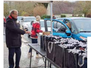
14 décembre Distribution des Colis des séniors