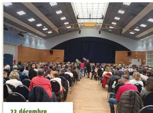
23 décembre Spectacle 100 % Noël