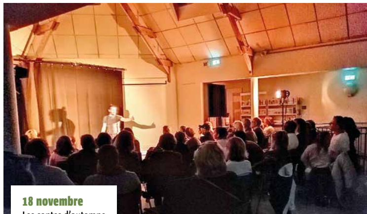
18 novembre Les contes d'automne à la Bibliothèque