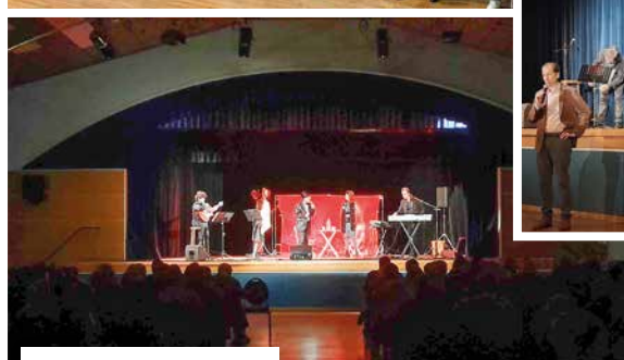
26 novembre Arbre de Noël des aînés