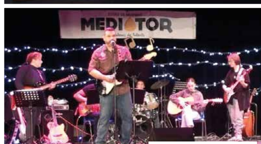
9 décembre Concert Médiator