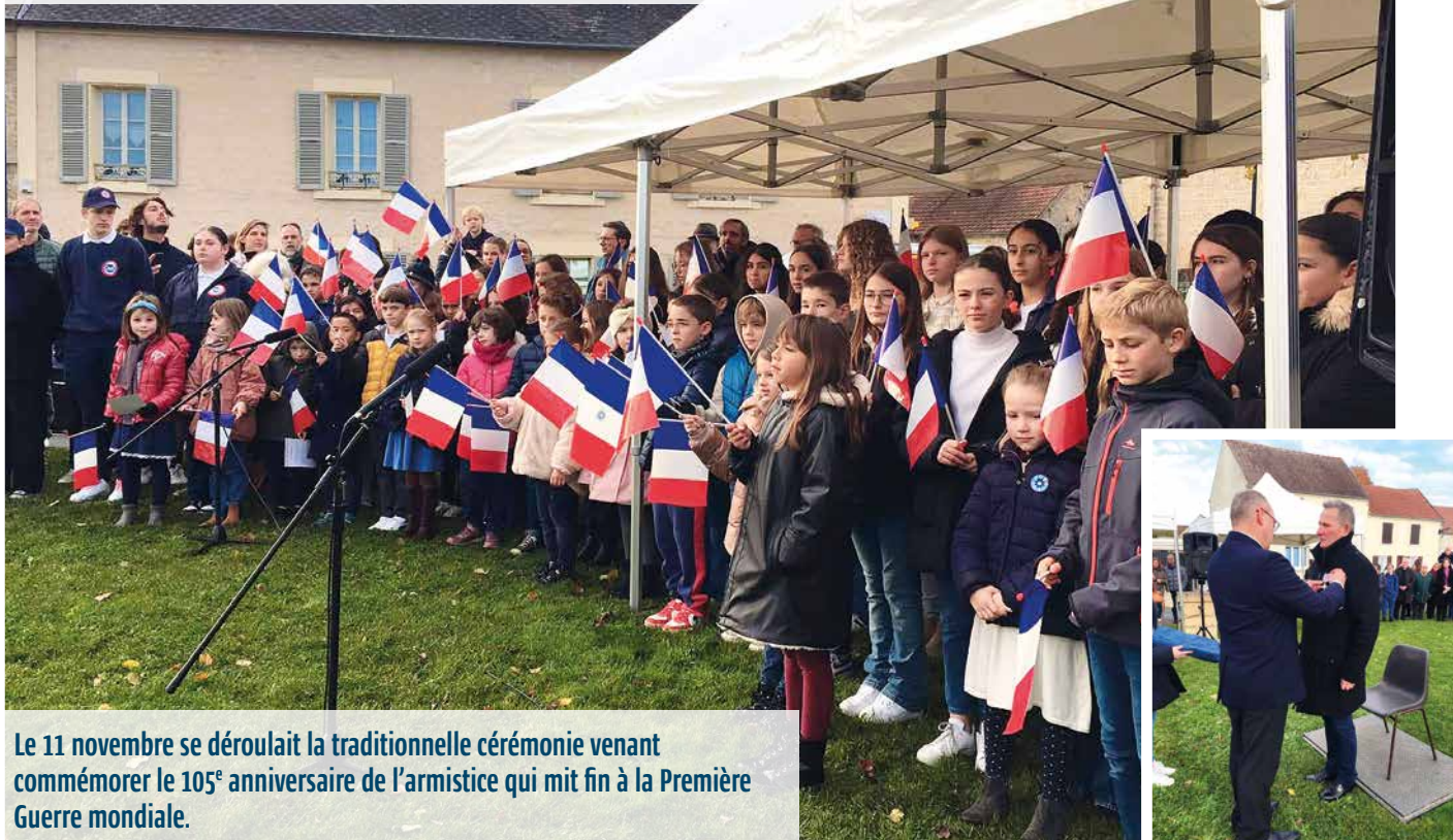
Le 11 novembre se déroulait la traditionnelle cérémonie venant commémorer le 105 e anniversaire de l'armistice qui mit fin à la Première Guerre mondiale.