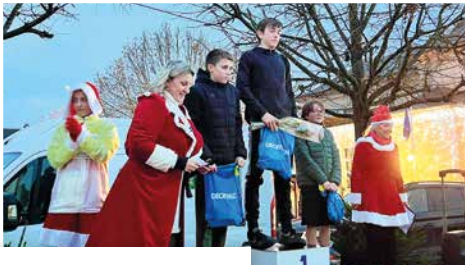
10 décembre Les Foulées de la Mère Noël