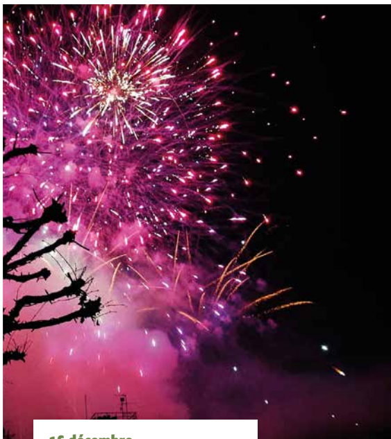
16 décembre Feu d'artifice du Marché de Noël