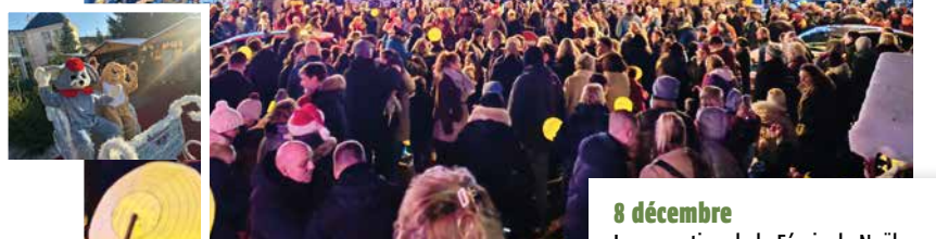
8 décembre Inauguration de la Fée de Noël