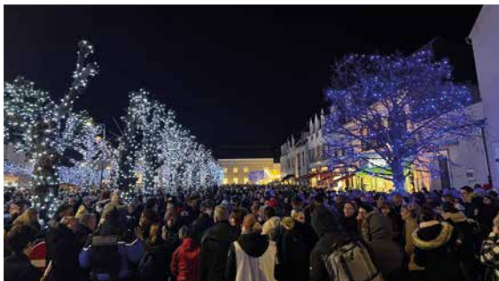
16 décembre Concert Arkadémia