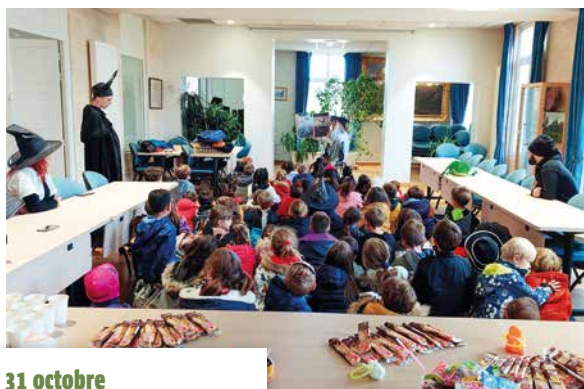
31 octobre La sorcière du Centre de loisirs