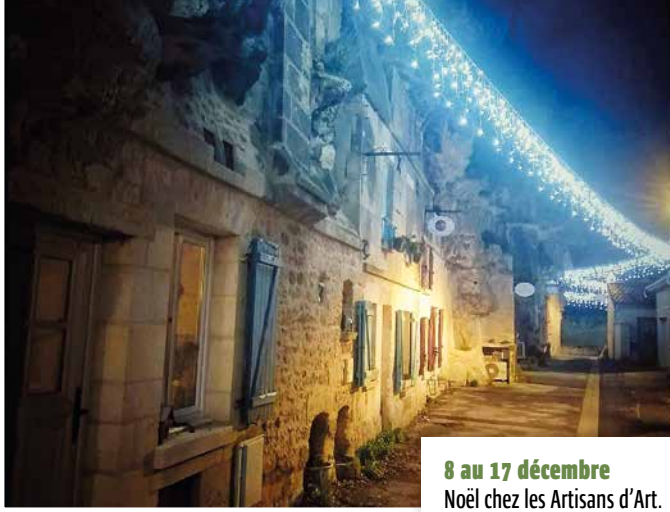
8 au 17 décembre Noël chez les Artisans d'Art.